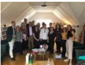
Grupp bild författar- och översättarcentrum