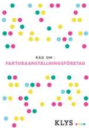
Broschyren "Råd om: fakturaanställningsföretag"