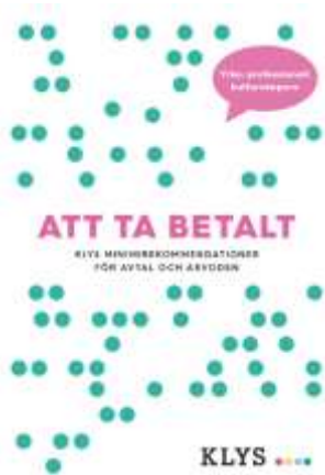
Broschyren "Att ta betalt"

Vi har under året fått en hel del utrymme i media (i såväl SR, SVT, de stora dagstidningarna och landsortspress) där vi har lyft viktiga frågor kopplade till konstnärspolitik, upphovsrätt, s.k. egenanställningsföretag osv. Vid flera tillfällen har KLYS synts i samband med diskussioner angående DSM-direktivet och talat för de positiva verkningar direktivet kommer att medföra för upphovspersonerna. KLYS har aktivt arbetat för att informera de folkvalda politikerna om direktivets olika delar och innebörder och för dess godkännande i EU.