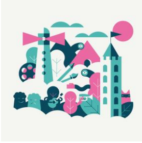
Illustration över upphovsrätten, Transfer Studios

När direktivet formellt skulle godkännas av den svenska riksdagens EU-nämnd hade dock alla svenska riksdagspartier förutom Socialdemokraterna bestämt sig för att säga nej till direktivet p.g.a. den kontroversiella artikel 13 (numera artikel 17). EU-nämnden tvingade därmed den svenska regeringen att vid ministerrådsmötet den 15 april gå emot sin egen linje och rösta nej. En klar majoritet av länderna i ministerrådet röstade dock för direktivet vid detta tillfälle, vilket innebär att direktivet ändå kunde antas . Medlemsstaterna har två år på sig att genomföra direktivet i nationell rätt och det ska vara genomfört senast den 7 juni 2021.