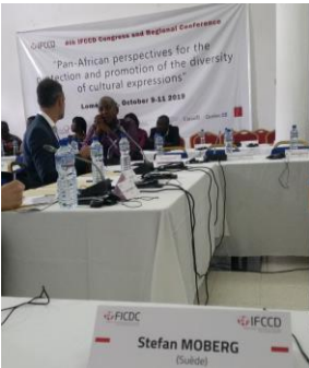
IFCCDs årsmöte i Togo i oktober 9-11 oktober