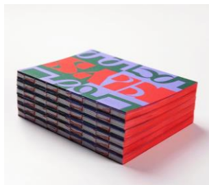
KLYS jubileumsbok

I samband med KLYS 60-årsjubileum lät KLYS ta fram en särskild jubileumsbok, KLYS 1959-2019 , med en överblick över KLYS sex decennier och hur KLYS ser på framtiden. Uppdraget som författare och redaktör av boken gick till journalisten och författaren Thord Eriksson. Formgivningsuppdraget gick till formgivningsbyrån Ateljé Grotesk.