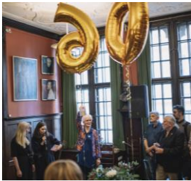
KLYS jubileumsfest på Konstnärshuset

Under hela året genomförde KLYS intervjuer med medlemsorganisationernas ordföranden vilka publicerades löpande på KLYS hemsida. I intervjuerna ställdes frågor om ordförandenas personliga motivation för sitt arbete och vad KLYS betytt för deras organisation genom åren. Eftersom intervjuerna publicerades parvis avslutades också varje intervju med en fråga om hur de ihopparade organisationernas arbete överlappat utanför klyssamarbetet och vilka möjligheter de såg för framtida samarbeten.