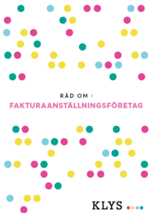
Broschyren "Råd om: Fakturaanställningsföretag"