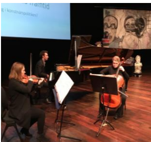
Medlemmar ur Ensemble Ars Nova framför Karin Rehnqvists Begynnelsen vid KLYS konferens på Malmö Live