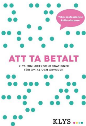
Broschyren "Att ta betalt"

KLYS skrev därför i januari till Arbetsförmedlingens ledning genom ett öppet brev som också skickades för kännedom till riksdag och regering för att protestera mot neddragningarna och värna Af Kultur medias verksamhet . Läs det öppna brevet här: http://www.klys.se/sla-vakt-om-af-kultur-media/