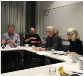
Mötesplatsen i Malmö 12 november

I december gavs Kulturrådet i uppdrag av regeringen att se över kultursamverkansmodellens konsekvenser för yrkesverksamma kulturskapare runt om i landet. KLYS deltar i det arbetet.