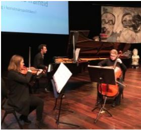
Ensamble Ars Nova på KLYS konferens på Malmö Live