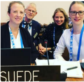
Den svenska delegationen under kulturkommissionen vid Unescos generalkonferens i Paris 20-22 november